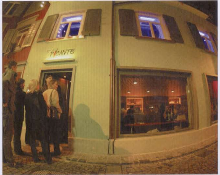
TEXT UND BILDER: MARCEL BAUMGARTNER

Die Bar «Picante» an der Augustinergasse gehört heute zu den modernsten und erfolgreichsten Gastrobetrieben in St. Gallen. Viel Stahl und Lavastein schmücken den Innenbereich. Dabei hätte auch alles anders kommen können. Wäre es nach dem Denkmalpfleger und der Baupolizei gegangen, so würde man verfaulte Balken und altes Täfer vorfinden.